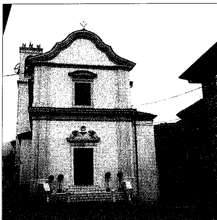
Chiesa dedicata a S. Giovanni Battista

Avanzo di amministrazione disponibile: 137.342.840