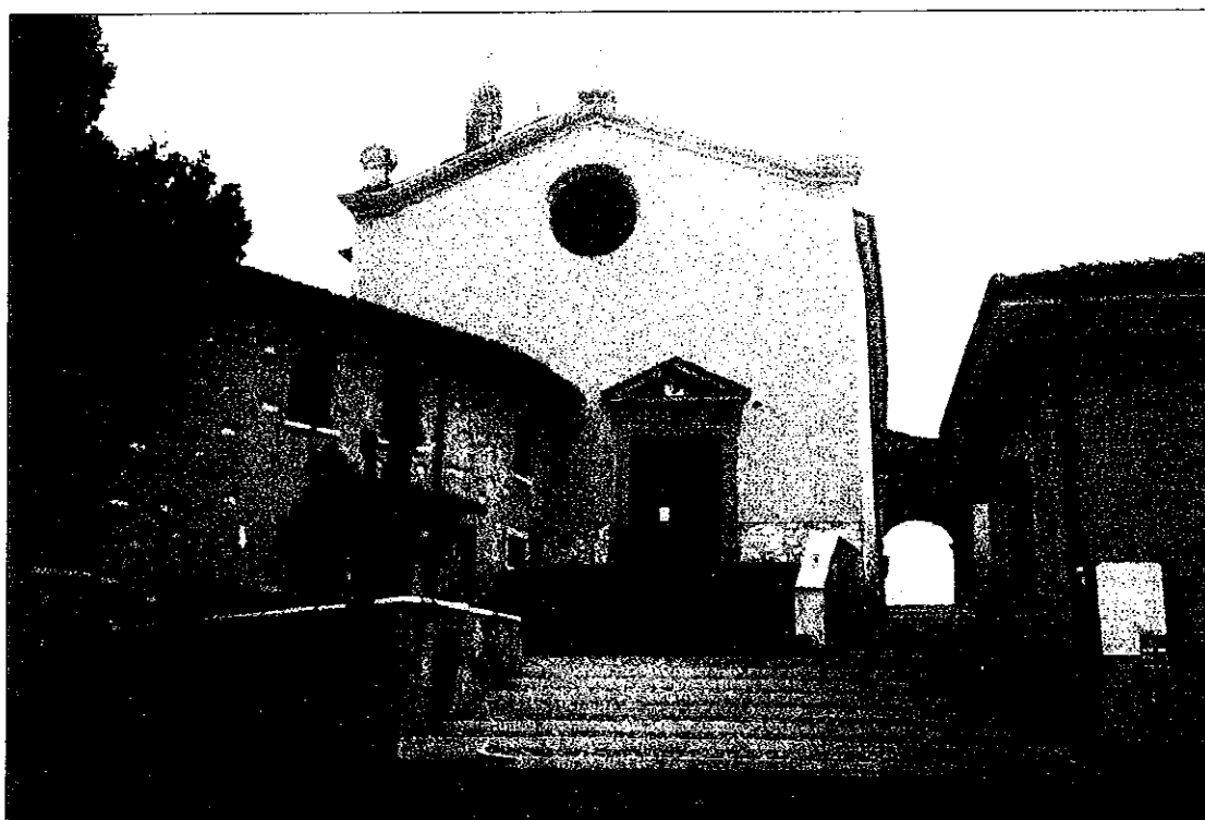
Chiesa parrocchiale S. Nicolò

Un altro lavoro iniziato che richiede un lento, ma costante impegno è la formazione di uno schedario che racchiuda tutti i libri in biblioteca in ordine alfabetico e la loro ubicazione all'interno della stessa, per permettere una rapida risposta all'utente ed una rapidissima ricerca all'interno della Biblioteca del libro richiesto. Si spera di completare tale lavoro entro il novembre 1995.